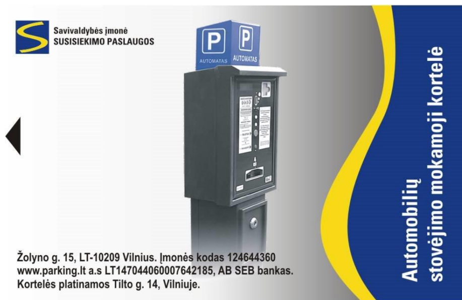
2 pav. Seno pavyzdžio kortelės pavyzdys